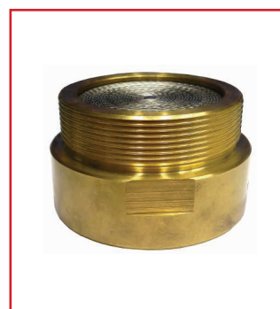
Rompifiamma (mod.330 ENP)