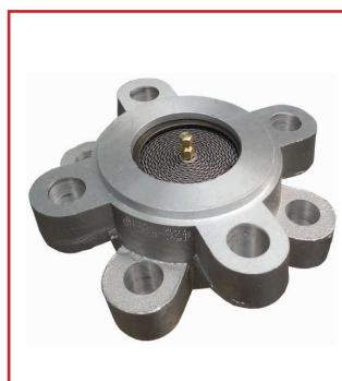
Rompifiamma (mod.446 ENP)