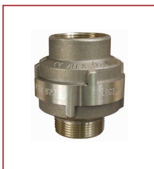
Rompifiamma (mod.180 EN)